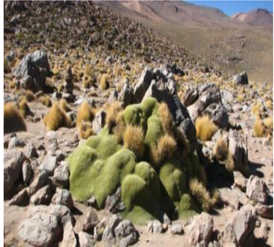
Llaretas, Azorella compacta 3000 años.