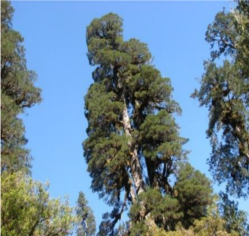
Alerce, Fitzroya cupressoides 3000 a 4000 años.