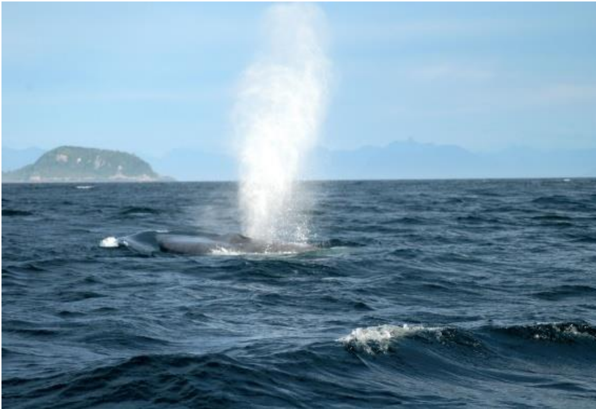
Ballena azul, Balaenoptera musculus